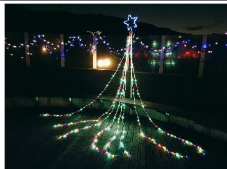
イルミネーション飾りつけ (県病院)