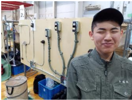
ものづくりコンテスト