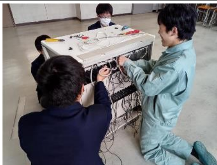
教室タブレット庫整備