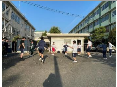
体力づくり_継続して実施