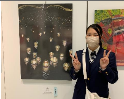
第48回全国総合文化祭 プレ大会 _ 11月