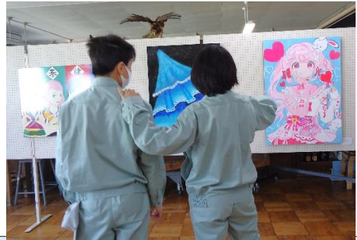
多工祭 展示_ 10月