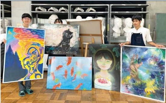
東濃地区高校美術展 入賞_ 8月