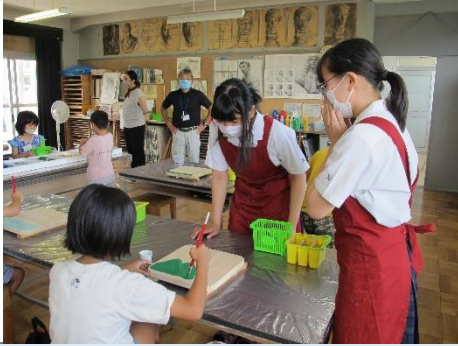
多工オープンキャンパス_ 7月