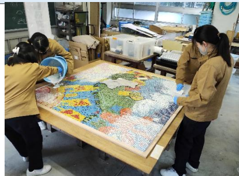
外部依頼・タイル壁画制作_5~11月