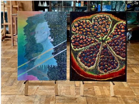
東濃地区高校美術展 出品_ 8月