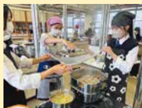
授業風景 (調理実習)