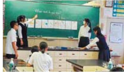
小学校での英語の授業補助 「小学校英語教育」ゼミ