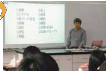
プロの指導で多治見高校をアニメに 「アニメ制作」ゼミ