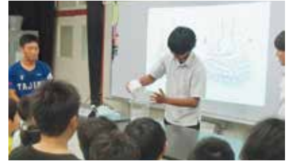
子どもたちに科学の楽しさを教える 「サイエンス・ショー」ゼミ

その他、「健康について考えよう」ゼミ、「スポーツ学・心理学」ゼミ、「まちづくり」ゼミ、「数学の秘密」ゼミ、「日本を発信！」ゼミ等の取り組みがあります。