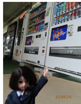
自動販売機。風が強くて、髪型が変。