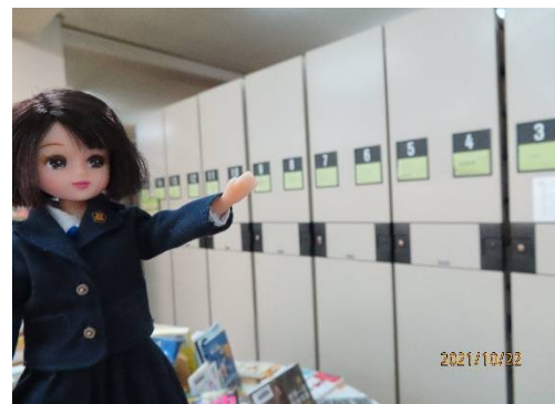
電動の書架よ。リカはポーっとしているの、ときどきはさまるわ。

そのときのタイムリーな話題から組まれる特集コーナーは、いつも新鮮な話題でいっぱいよ。今は、おおたにくんに、キュンっね。