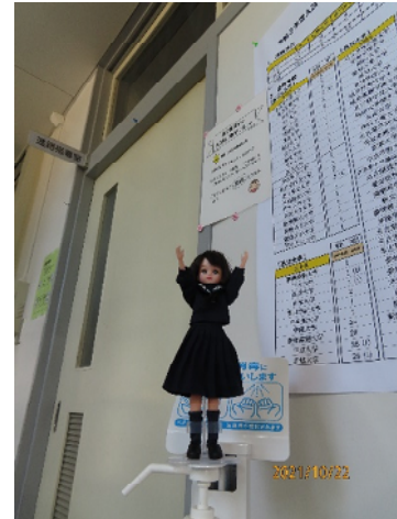
進路指導室で一す

私たちの将来について考える部屋よ。たくさんの資料があるわ。この部屋には、進路に関して物知りな先生が、4人みえるわ。コロナの関係で、ほかの部屋にもいらっしゃるので、相談する先生の選択に、よく迷うわ。