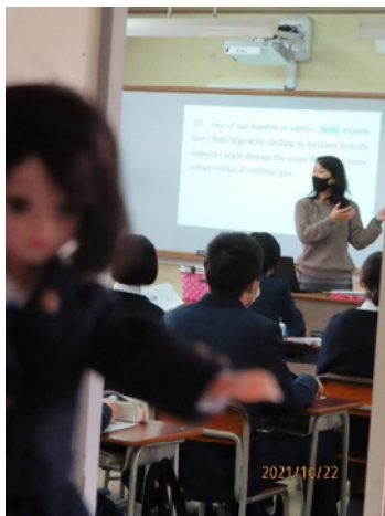
I C T 活用中