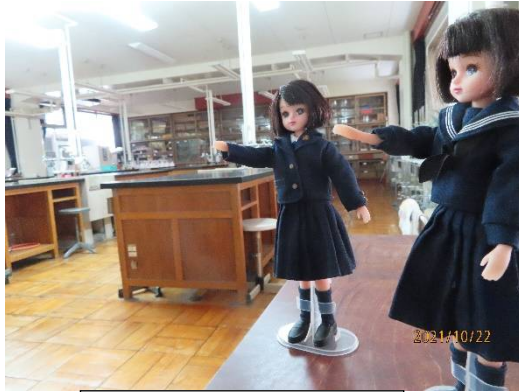
化学室の中でーす