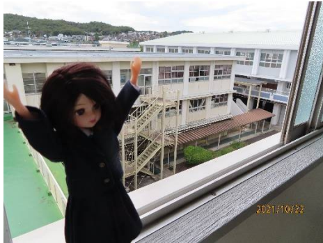
南側で一す。体育館と2号館よ。