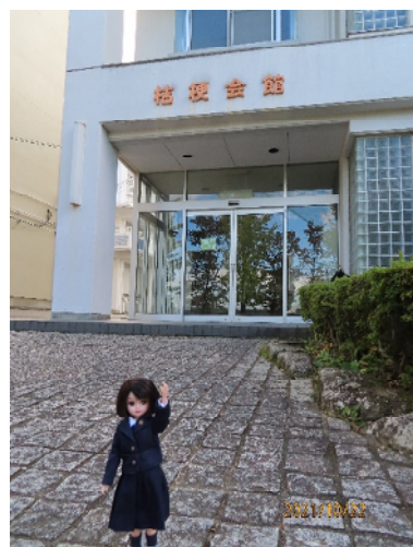
桔梗会館 同窓会館です。3階建

桔梗会館【同窓会館】は、食堂やお風呂もある宿泊施設です。普段は、部活動 【茶道部・演劇部・野球部】や学習施設として使用しているのよ。