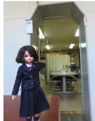
教育相談室ですよ

悩むことは、普通なのよ。だって、それは考えてるってことだし、勉強してるってことだから。