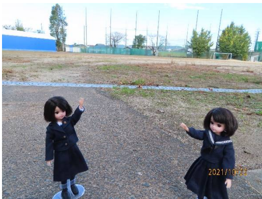
グラウンドで一す

このグラウンドは、野球部やサッカー部、陸上部が練習している場所よ。奥の右手に弓道場があって、ときどき弓道部もここに出てきて、型の練習をしているわ。形がサマになるので、女子に人気の部活動よ。