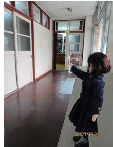
化学室の入り口よ