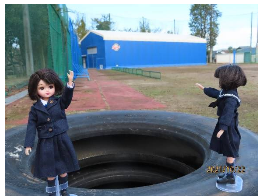
野球部の室内練習場で一す

野球部は、2017年に甲子園に出場しているのよ。この出場を記念してOBや多治見市民の皆様の協力で建設されたのが、ブルーの色の全時間・全天候型施設よ。中は人工芝が敷かれていて、ピッチングマシンによる打撃練習や投球練習、ウェイトトレーニングなどができるの。2度目の出場を狙って、毎日練習しているのよ。