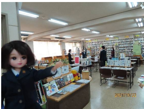
図書館の左の方。雑誌が。

そのときのタイムリーな話題から組まれる特集コーナーは、いつも新鮮な話題でいっぱいよ。今は、おおたにくんに、キュンっね。