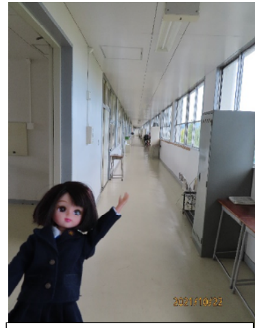
2年次生の教室で一す

この1号館を4階まで登ってきたわよ。さすがのリカも、ここまで来るのは大変よ。でも、4階からは多治見市内が一望できるから、この階は気に入ってるわ。