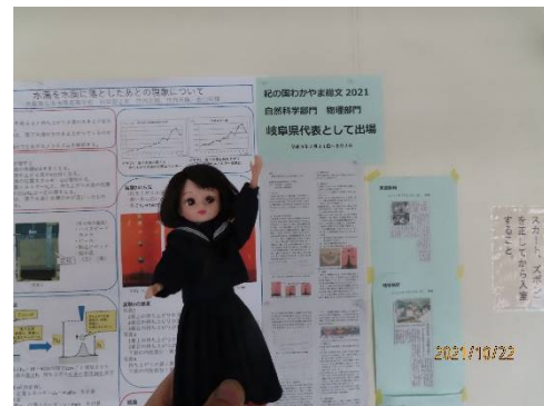
研究発表紹介中でーす