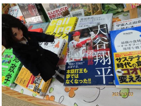
楽しみにしている特集コーナー

今日の紹介は、ここまでね。気が向いたら、次は庭の石像や体育館、プールなんかを紹介するわね。【桔梗】