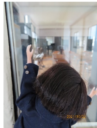
んー、リカには見えるんだけど、上手く映らないー