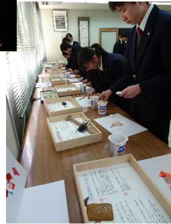
作品から受けたインスピレーションをさらに作品として自己表現