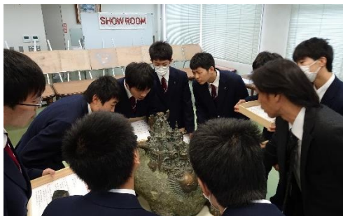
触れる立体作品もありました