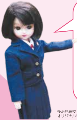
多治見高校 オリジナルリカちゃん

一人一人の適性や興味・関心により、学習したい科目、将来の進路希望を見据えた科目が選択できます。単位制を活かして、能動的・主体的な学習に取り組める環境を提供します。