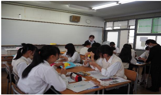
保育・幼児教育（保育のお仕事）

2・3年次生を対象に進路ガイダンスを行いました。大学や短大、専門学校の先生をお招きし、全部で22の講座に分かれて、模擬授業を受けました。文学、工学、看護学、法学、栄養学、美容など、様々な分野から、自分の進路希望に合わせて、2つの分野を選び、受講しました。