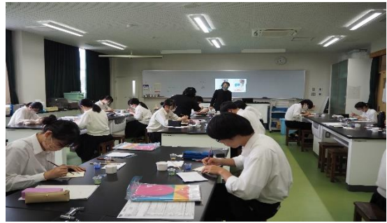
芸術学（日本画面材・見て触って描く！）