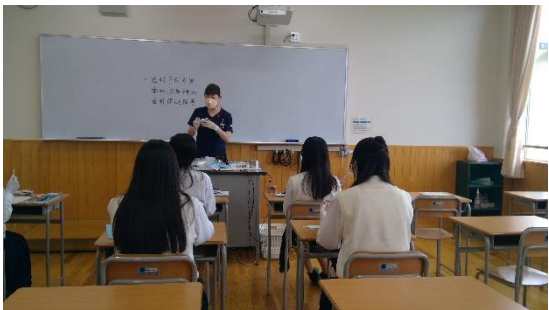
歯科衛生（歯科衛生の世界を体験してみよう）