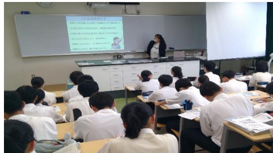
心理学 （「マルトリートメント」って知っていますか？）