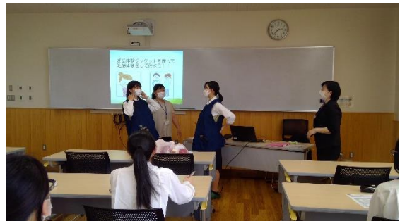
看護（妊婦体験を通して「妊娠」を知る）