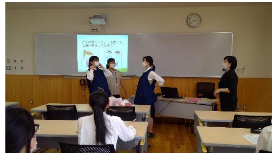
看護（妊婦体験を通して「妊娠」を知る）