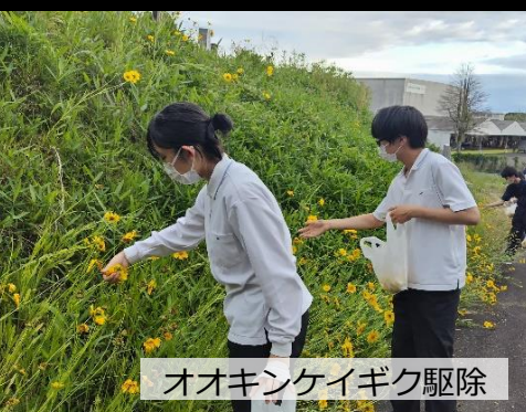
オオキンケイギク駆除