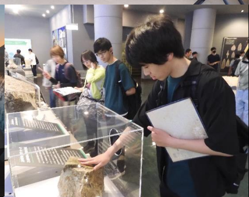
日本最古の石博物館