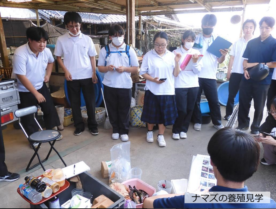
ナマズの養殖見学