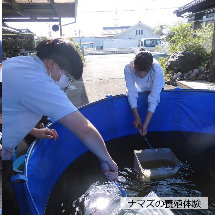
ナマズの養殖体験