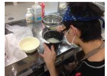
▲総合的な学習の時間