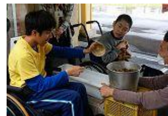
▲生活単元学習の授業

また、教科学習では、内容を精選し、一人一人の実態に応じた細かな支援を行うことで、学習内容の定着を図っています。