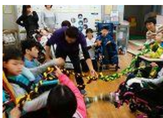
▲自立活動(悠・Youタイム)