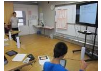
▲iPad等を活用した国語

特別活動や総合的な学習においては、体験的な学習を通して学んだことをまとめたり、仲間に伝えたりすることで、人と関わる力の育成や、社会で生きるための基礎力作りにも取り組んでいます。