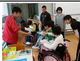
▲生活単元学習の授業

3組では、日常生活の指導、教科等を合わせた指導である生活単元学習、作業学習並びに自立活動を柱にしています。これらの活動を通して生徒一人一人の理解力を深めると同時に、人との関わりから社会性を養い、見通しをもって活動する力を育てています。