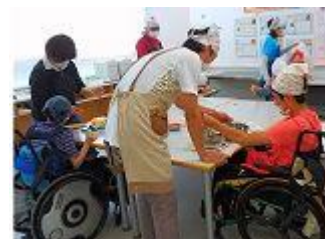
▲作業学習(クッキー作りの授業