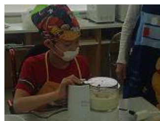
▲作業学習(クッキー作りの授業