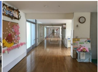
廊下(1階・玄関側から)