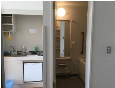
自立の部屋(一人暮らしのトレーニング)