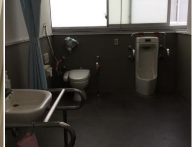
トイレ(1・2階男女別に2箇所ずつ有り)