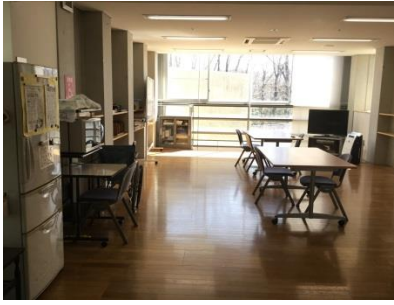
多目的ホール(憩いの部屋)