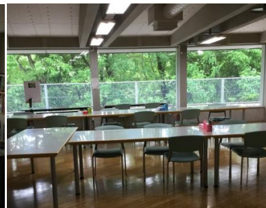
食堂(朝・夕 ランチルームを使用)