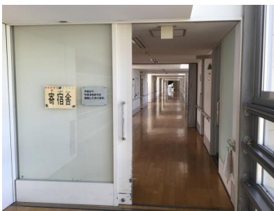
廊下(2階・本館棟側から)