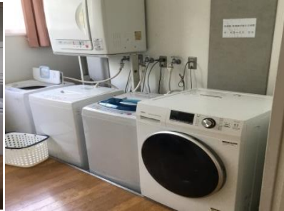
洗濯場(1・2階に有り)