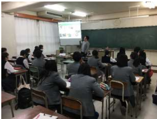
美濃加茂市生涯学習センターでの学習支援の様子（上写真）