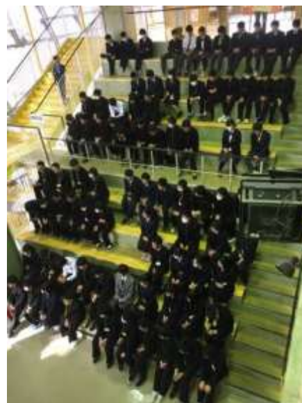
一堂に会した県下の高校生(右写真)

当日は岐阜県内から80名以上の高校生が集い、会場に集まった小学生やその保護者対象の実験講座やプレゼン等を行いました。本校からは霊長類研究班が参加し、ゴリラの行動観察の成果をわかりやすく説明しました。