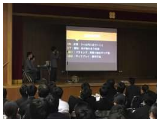
霊長類研究班の発表の様子

研究者や大学院生が集う本格的な学術発表会であり、専門的な質疑応答が行われる中、本校生徒も研究成果を発表しました。