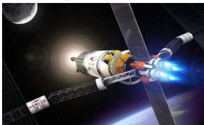
図 1 NASA で研究が進められる火星探査用プラズマロケット(想像図)

この燃費の悪さはロケットが開発されてからの 90 年間ほとんど変わっていません。ロケットの燃費の悪さが長年の間、宇宙開発の大きな障害となってきました。今から 50 年前にアポロ計画で人類が月に行った後に再び月に行った人がいないのは、ロケットの燃費が悪くお金がかかりすぎるからです。人類が再び月に行ったり、その先の火星に行くに