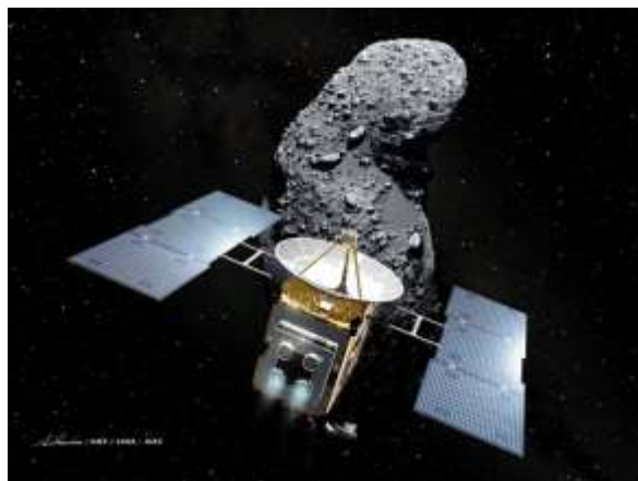
図 2 探査機「はやぶさ」©JAXA

2010 年に地球に帰ってきた探査機「はやぶさ」は 60 億 km にも及ぶ旅をたった 70kg の燃料によって達成しました(図 2)。この旅は「はやぶさ」に搭載されたプラズマロケットの燃費の良さのお陰で可能になりました。「はやぶさ」では燃料に割く重量が減ることでカメラやレーダー、物質分析装置などの実験装置をより多く搭載することが可能になり、小惑星ができる仕組みから太陽系ができる仕組み、そして地球に生命が誕生した理由などの研究に役立つ数多くのデータを取ることに成功しました。