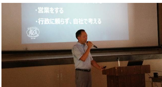
↑ 熱意を持ってお話しく下さいました。