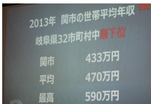
↑ 関市の平均年収に驚き。