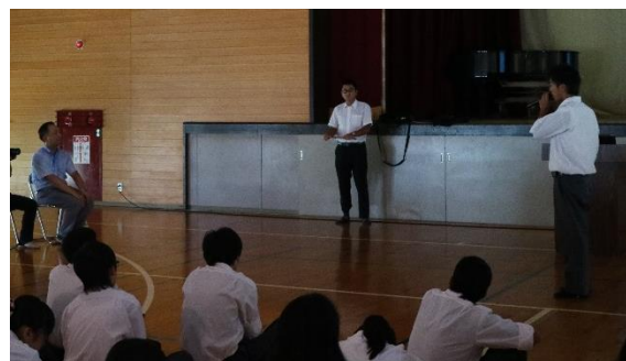
↑ 生徒代表が感謝の言葉を述べました。