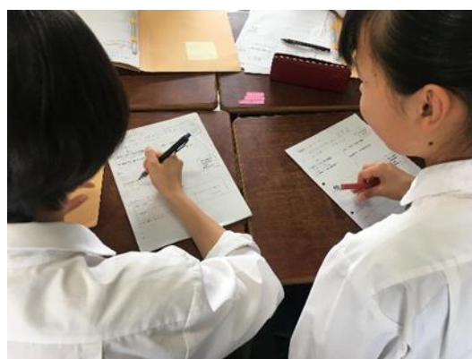
ワークシートを作成しながらテーマを絞っていきます

また、本校が課題解決型研究において継続的に取り組んできたテーマである「LGBT」「アレックスレモネードスタンド」「フェアトレード」「米粉の活用」などの研究を引き継ぐグループもいます。