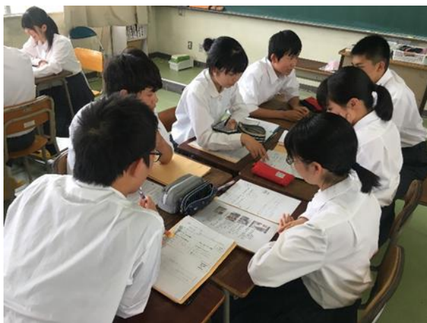
グループの仲間が持ち寄った課題を検討する様子

1 年生の課題解決型研究が少しずつ動き出しています。1 年生にとっては「課題解決型研究」という取り組みが初めてであるため、何もかもが手探りです。そのような中でも、2 度の課題解決型研究入門講座を参考にして、仲間と意見を出し合いながら、関市やその周辺地域の課題解決に向けて取り組み始めました。