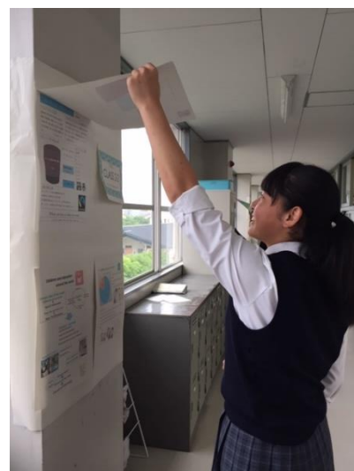
👉 掲示中のポスターを見ています