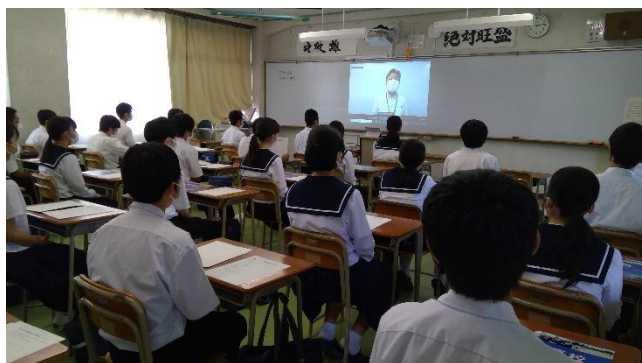
配信を受ける教室の風景

まず、全体説明を行いました。各教室に30～35名ずつ入り、そのうち1教室で説明を行い、それを各教室に配信する形を行いました。次に、関高校は本来50分の授業ですが、30分ずつ、2科目の体験授業を行いました。会場は最初の教室のままですが、全員分の顕微鏡を持ち込んだり、それぞれの意見を発表する場があったりと、出来る範囲の活動もある授業が展開されました。授業後は、希望者がいくつかの活動している部活動や、新しくなった図書館の中を見学して帰りました。