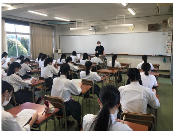
進路指導部長より説明がありました。

例年、関高校から多くの生徒が看護系の学校に合格し、看護師として地域に貢献しています。本日参加した生徒たちも、数年後には看護師として岐阜県の医療に貢献してくれるものと期待します。