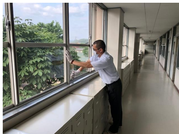
廊下も消毒しています