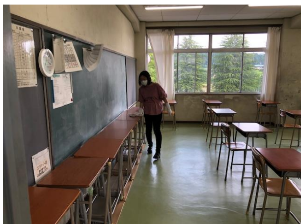
教室の消毒の様子