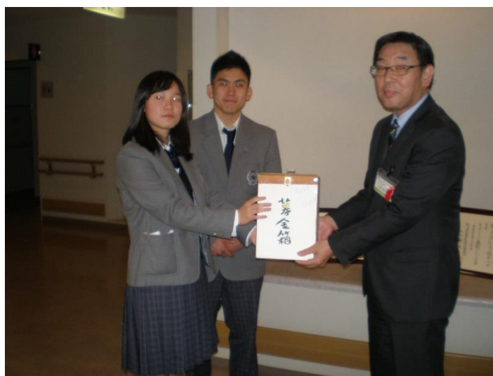
生徒会副会長と書記が、募金を届けてくれました。