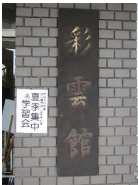
毎年「彩雲館」で実施します

朝8:30～夕方4:45、短い休憩を挟んで、35名が黙々と各自の課題に取り組みました。冷房がきいた彩雲館2階大研修室で、今年は一人長机1台をゆったりと使って学習しました。家庭で学習するのとはまた違って集中できた、という声もありました。「決戦の秋」に備えます。