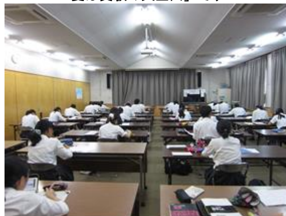
皆が頑張るから自分も頑張れる！ これで学習のペースが確立します。