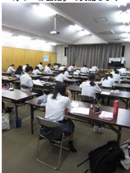
一人長机1台！ エアコンの部屋で集中します！