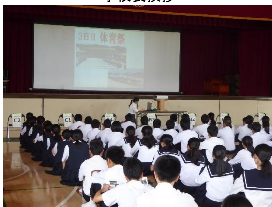
生徒会による学校紹介