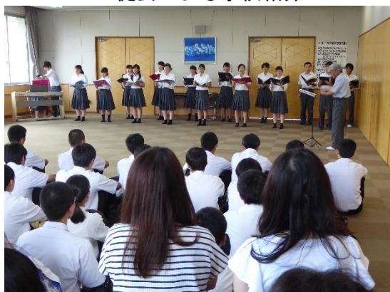
コーラス部による歓迎合唱