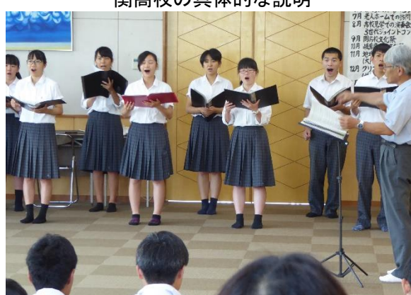
コーラス部による歓迎合唱