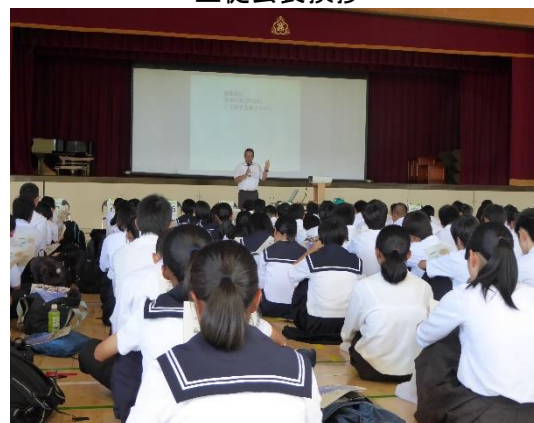
関高校の具体的な説明