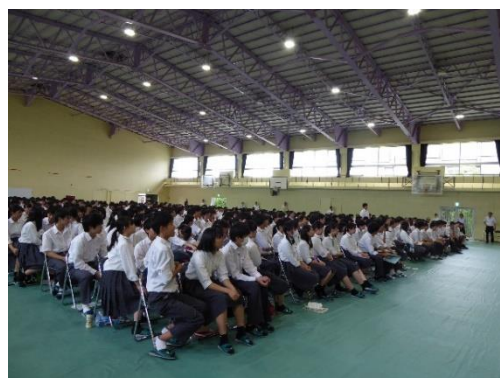
生徒は質問内容にも興味津々です