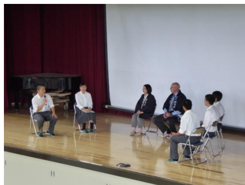
講演の内容に興味を持っていた生徒と、 座談会形式で質疑応答を行いました