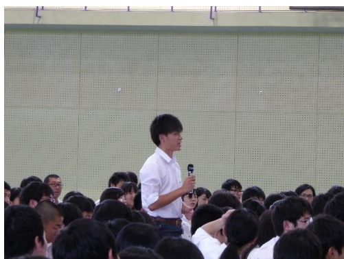
英語でも質問しました