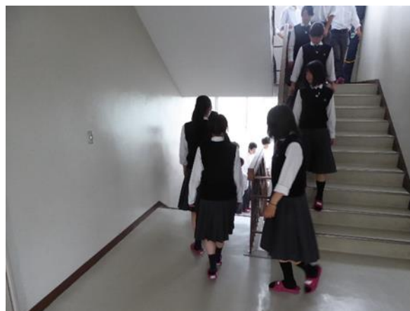
静かに体育館へ避難しました