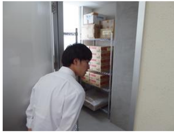
学校内の備蓄品の確認もしました。