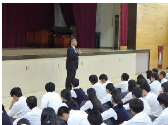
校長先生からの講評