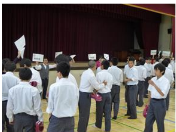
防災組織の係の確認をしました。