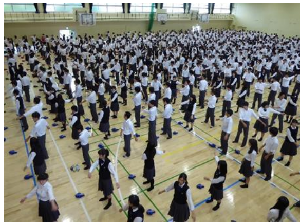
全校生徒でラジオ体操