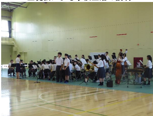
吹奏楽部の歓迎演奏