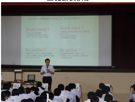
関高アイデンティティー+One