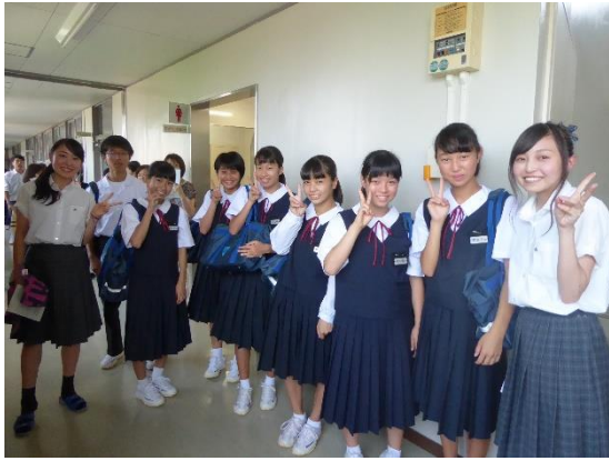
校内見学 案内係の関高生と記念写真