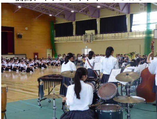
吹奏楽部の歓迎演奏