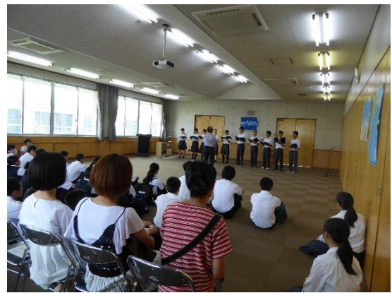
コーラス部による歓迎演奏