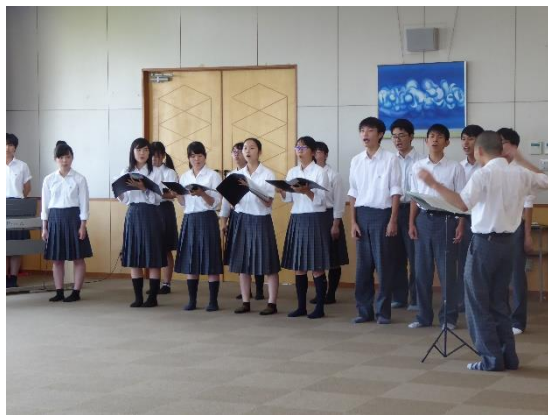
コーラス部による歓迎演奏