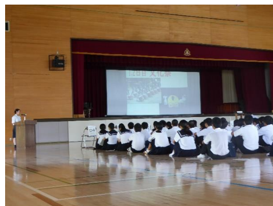
生徒会による学校生活の説明