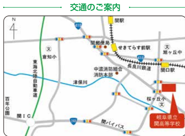
■交通機関/長良川鉄道 関口駅から徒歩8分