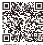
関高校ホームページ

〒501-3903 岐阜県関市桜ヶ丘2丁目1-1 TEL (0575)22-5688(代) FAX (0575)23-7089 URL https://school.gifu-net.ed.jp/seki-hs/ E-mail c27322@gifu-net.ed.jp