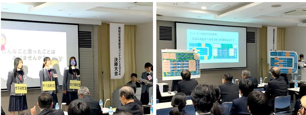
ジェンダーについて 楽しく考え、学ぶ教材 LOL~Let's Original Life~

決勝大会では、1チーム10分程度のプレゼンテーションが行われ、高校生が審査員の前でそれぞれが考えたアイデアについて、その実現方法などを発表しました。審査は、アイデアの独自性『発想力』、根拠の明確性や情報の信ぴょう性『情報収集力』、プレゼンテーションの『表現力』を基準に40点満点+発表時間による得点で評価され、入賞した5チームには賞状の他に賞金が贈られました。