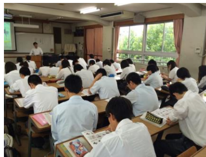
熱気あふれる教室！