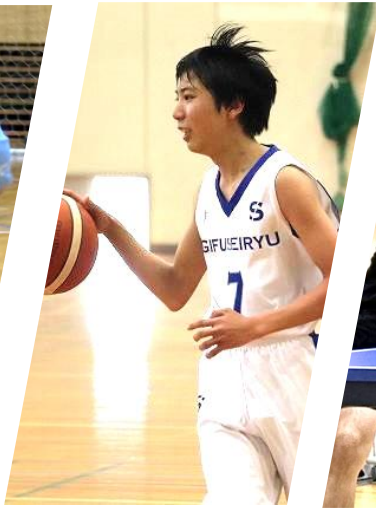
バスケット ボール