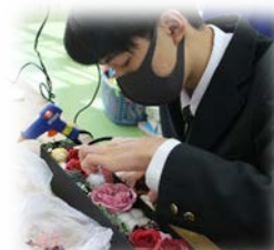
↓ フラワーアレンジメント