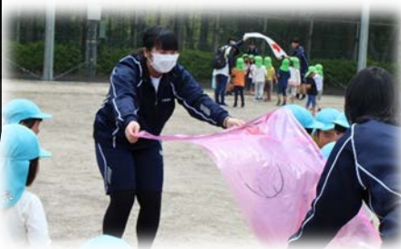
↑ やさかこども園との交流