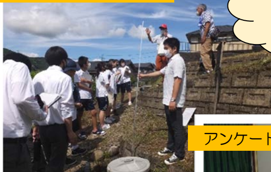
阿寺断層実地調査

坂下高校では、学校だけにとどまらず 地域の人々との交流 があります！ これまでに、「総合的な探究の時間」で行った授業例がこちら↓↓↓