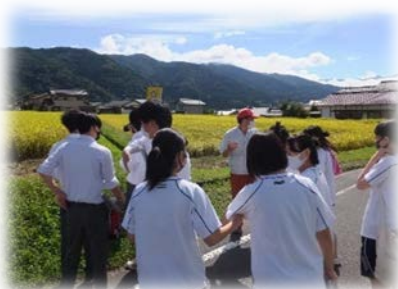
フィールドワーク

※1 年間20日程度、学校を離れて、企業就労を体験する授業 ※2 国語と数学の学び直し