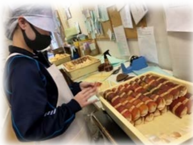
デュアルシステム