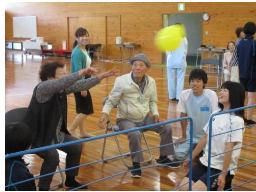
【 風船バレーの様子 】

10月16日(水)に、福祉科3年生と生活文化科3年生の生徒が、本校で「ふれあいサロン」を実施しました。内容は「パラバルーン、風船バレー」「ボーリング」「中津川かるた」「紙飛行機飛ばし」の4種類で、地域の方との交流を深めることができました。