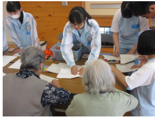
【 紙飛行機づくりの様子 】