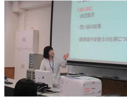
【 講義の様子 】

10月17日(木)に、生活文化科3年生フードコースの生徒が、坂下小学校から栄養士の先生を招き、給食開発に向けた講義を受けました。昨年度に引き続き、本校の生徒が開発したメニューを坂下小学校の生徒に提供できるように、真剣に講義に耳を傾けていました。今年の12月に提供する予定です。