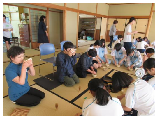
【 呈茶の様子 】