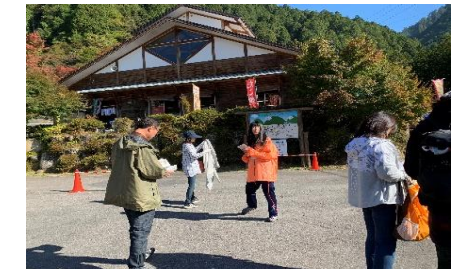
【 夕森もみじ祭りの様子 】

10月21日現在、延べ211名の生徒が地域のボランティア活動に参加しました。今年度、全校生徒の約70%の生徒が地域のボランティアに参加しています。