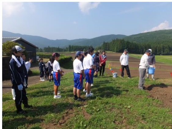
【そばの種まき講習の様子】

8月19日(月)に椈の湖にて、そばの種まきボランティアが行われました。坂下高校から19人の生徒が、今年から参加した坂下中学校の生徒の皆さんと一緒に、そばの種まきをしました。当日は炎天下、汗が流れる中で、広い畑の中を何度も行き来しました。9月には畑一面に真っ白なじゅうたんのような花が咲き、椈の湖そばの花祭りが開催され、その後、そばの収穫が行われます。