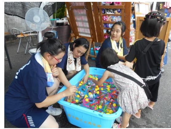
【与三郎祭りの様子】