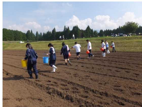
【そばの種まきの様子】