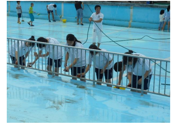
【松源寺プール清掃の様子】