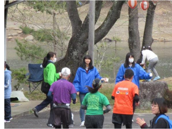
【椈の湖還暦マラソンの様子】

坂下高校はボランティア活動に積極的に取り組んでおり、今年度は8月23日現在で105人(全校生徒155人)の生徒が何らかのボランティアに参加しました。参加率は68%で、すでに昨年の参加率を上回っています。ボランティアに参加することは、地域の皆さんとの交流の機会がもてるのはもちろん、自分の住んでいる地域を知る良い機会でもあります。坂下高校では、1年間で全員の生徒が、1回はボランティア活動に参加することを目標にしています。