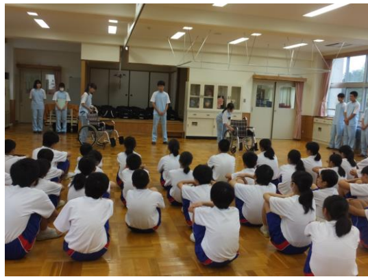
【福祉科生徒による説明】

7月11日(木)に坂下中学校の1年生49人を対象に福祉体験をしてもらいました。本校福祉科2・3年生が車椅子についての説明をした後、実際に中学生に車椅子の体験をしてもらいました。段差がある個所など、上手に車椅子を扱うことができ、福祉の入り口について考えてもらいました。