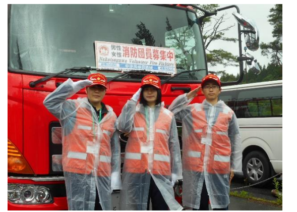
【ファイヤーボランティア消防操法大会の様子】