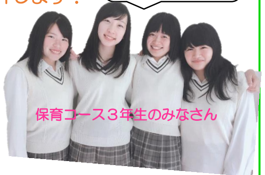
保育コース3年生のみなさん

保育コースでは主に、壁面構成(造形表現技術検定)、ピアノ(音楽リズム表現技術検定)についての勉強や、離乳食体験、保育実習などの活動、言語表現技術検定、看護技術検定に向けての勉強などを行っています。コースの授業はどれも自分の興味のあることなので、とても楽しいです！