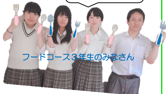
フードコース3年生のみなさん