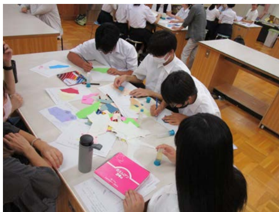
◀ 造形体験の様子 ▶