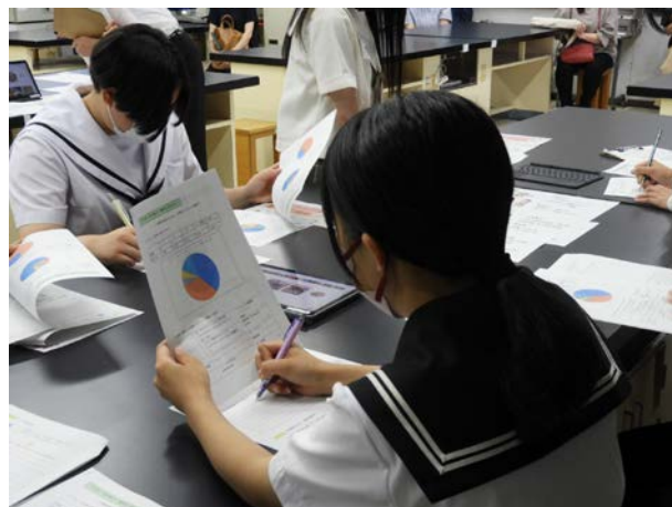
◀ グループによる探究活動の様子 ▶