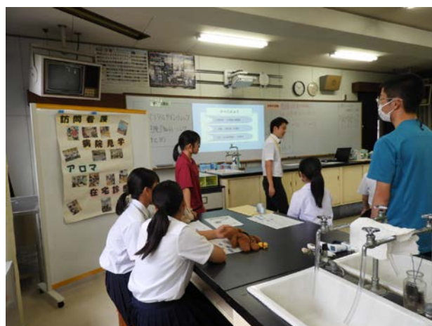
◀ 全体説明の様子 ▶