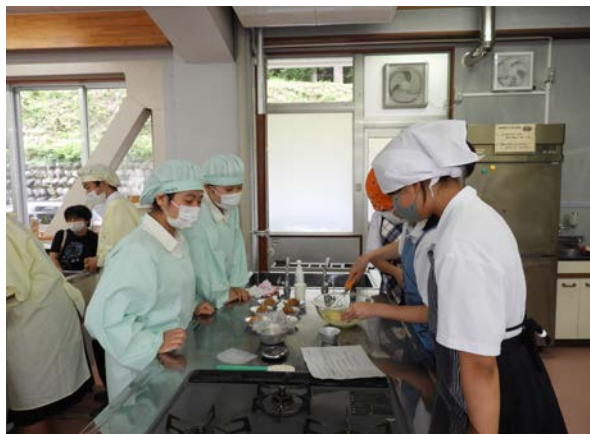
◀ シュークリーム作り体験の様子 ▶