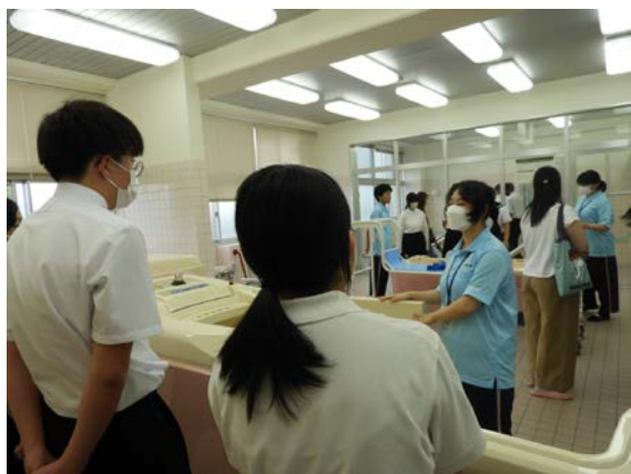
◀ 生徒による入浴体験の紹介の様子 ▶