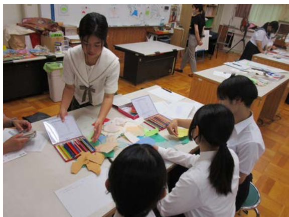
◀ 造形体験の様子 ▶