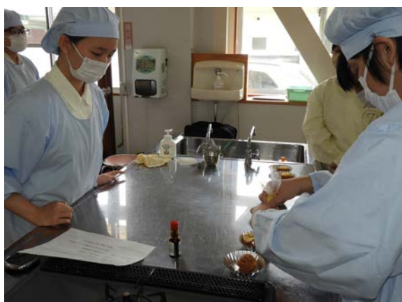
◀ シュークリーム作り体験の様子 ▶