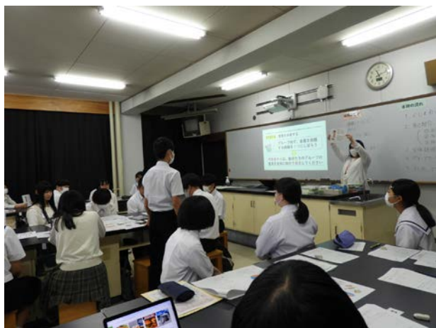
◀ 全体説明の様子 ▶