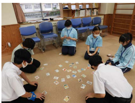
◀ 福祉体験の様子 ▶