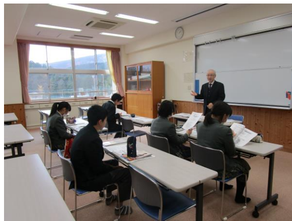
分野別説明会の様子↑