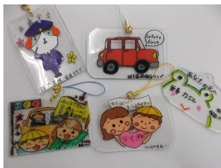
▲ 出来上がった啓発グッズ