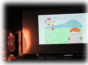
▲絵本の読み聞かせの様子