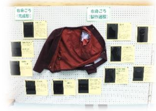
▲ファッションコースの展示