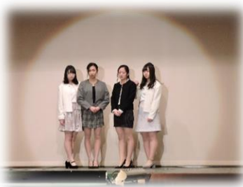
▲裏付きジャケット