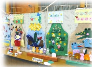
▲保育コースの展示