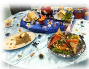
▲フードコースの展示