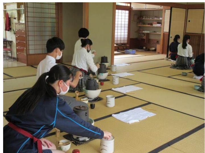
生活文化科授業風景【茶道】