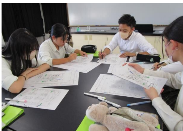
(地域探究科「総合的な探究の時間」の様子)