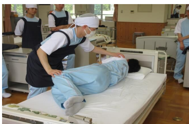
(福祉科「生活支援技術」の様子)