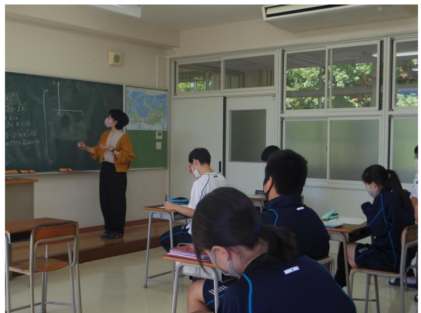
普通科授業風景【数学 I】