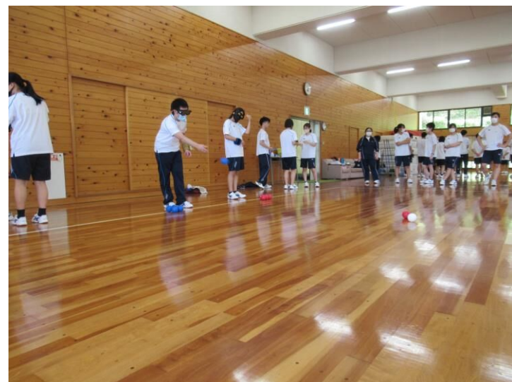
福祉科授業風景【福祉科集会】