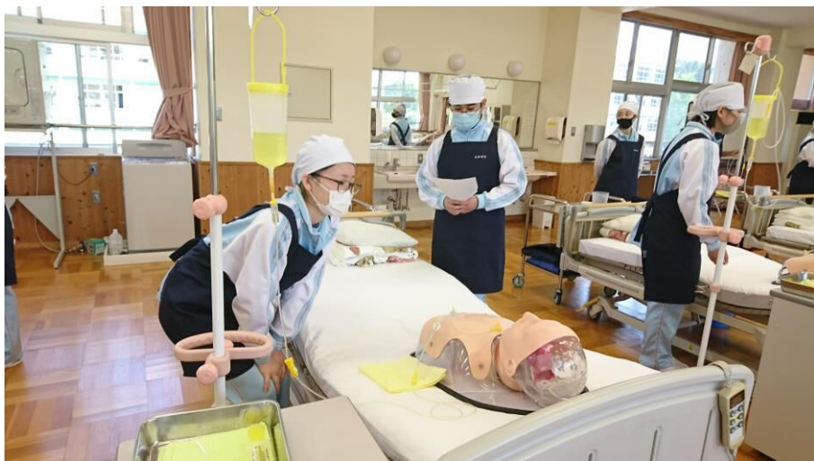
福祉科授業風景【生活支援技術】