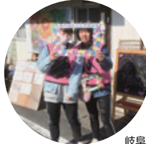
岐阜のはじっこマルシェボランティア