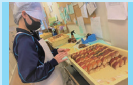
インターンシップ