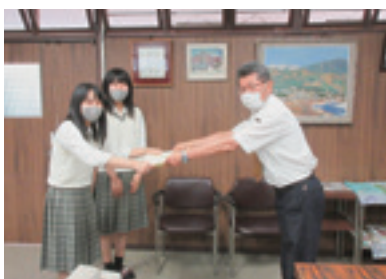
JR表彰 (坂下駅座布団設置)