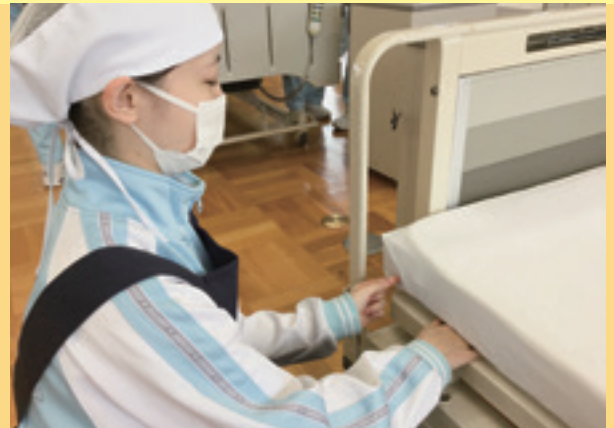
ベッドメイキング