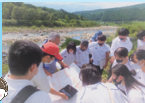
総合的な探究の時間

未来共生コースでは、2年次に週1回を目安とする長期企業実習を行います。実施にあたり、個別の進路相談や企業との面談を行い、一人一人に合った実習を体験することができます。また、事前・事後の取り組みにより、社会に求められる資質を養うことができます。