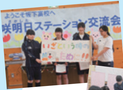
さかした 咲明日ステーション交流会