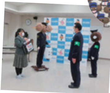
御用の五平くん製作プロジェクト