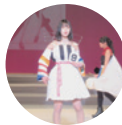
2020大垣ファッションフェスティバル入賞