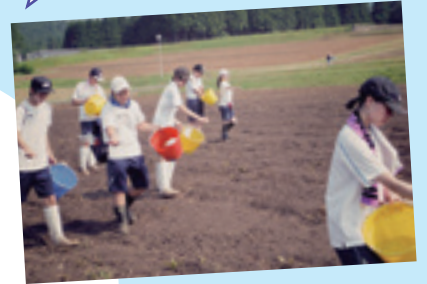
はなうみ そばの種まき