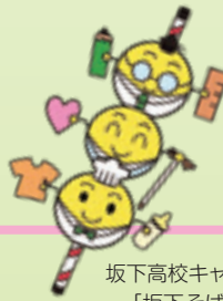
坂下高校キャラクター 「坂下そばーず」