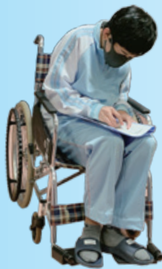
障がい者支援施設の見学