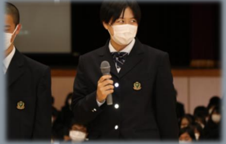
生徒会長による突撃インタビューにも、動じず落ち着いて答える新入生