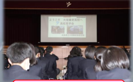
学校紹介動画の視聴