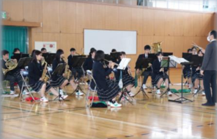
吹奏楽部による新入生歓迎演奏

最後に、これから多くの場面で、多くの方にお世話になるとと思いますが、どうぞよろしくお願い致します。