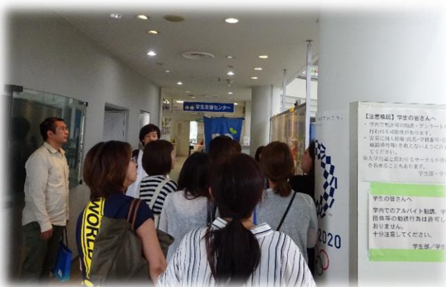
学生支援センター・ミーティングルーム