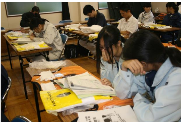
開会式直前まで、最終確認をする4名