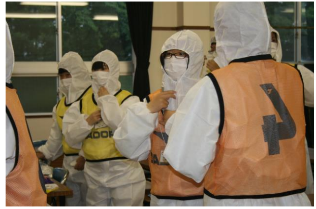
防疫の関係で、防護服・マスク・手袋を着 用しての競技。本校生徒はゼッケン番号が オレンジ4, 5番、黄色4, 5番です。