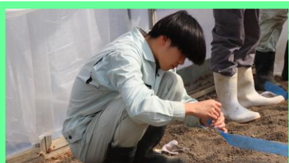
グリーンマルチの縁を土で押さえる。