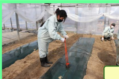
ホーラーを使って担当区の植穴を掘る。