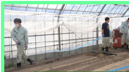
それぞれ担当する畝に灌水チューブを敷設する。