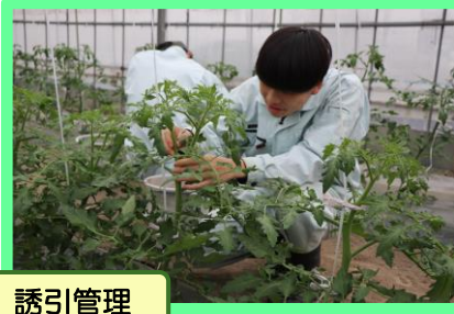
4月 3日 誘引管理