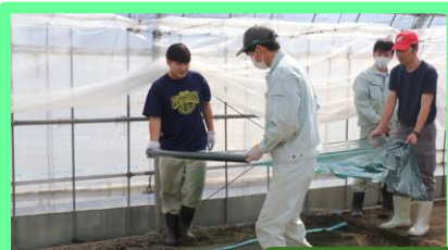
グリーンマルチを広げる。