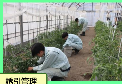
4月 8日 誘引管理