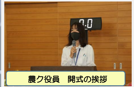
農ク役員 開式の挨拶