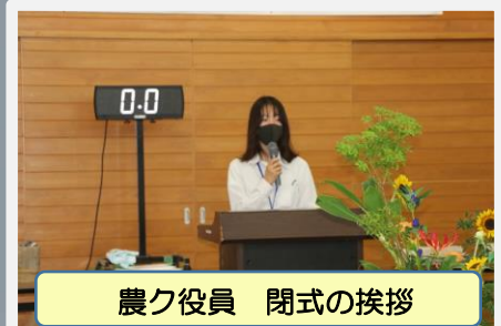
農ク役員 閉式の挨拶