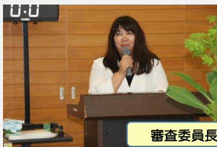
審査委員長による指導講評