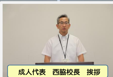
成人代表 西脇校長 挨拶