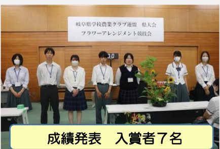
成績発表 入賞者7名