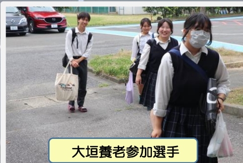
大垣養老参加選手