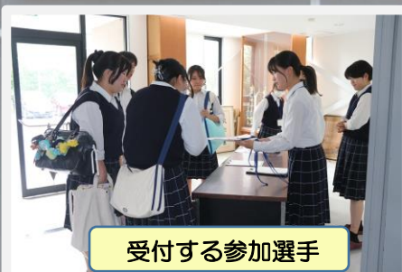
受付する参加選手