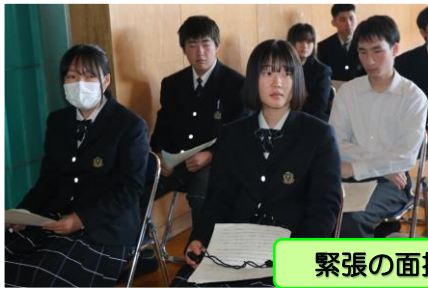
緊張の面持ちの発表者