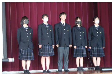
農業クラブ役員紹介