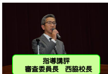
指導講評 審査委員長 西脇校長