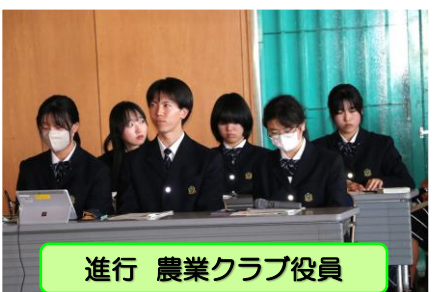
進行 農業クラブ役員