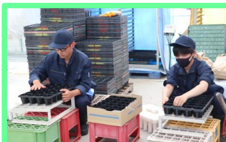
次回実習の準備として、24穴接続ポットに培養土を詰めます