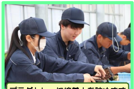
プラグトレーに培養土を詰めます