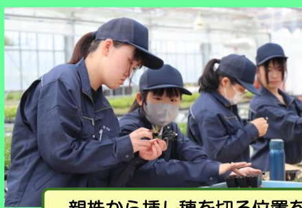
親株から挿し穂を切る位置を確認し、切断した挿し穂を10本束ね、プラグトレーに挿しこみます