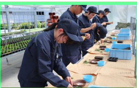
発根促進剤を付けて挿し込みます