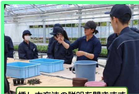
挿し木方法の説明を聞きます