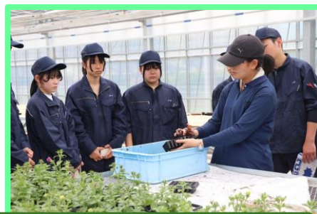
播種の方法（土の充填、植穴の空け方、種の播き方、覆土の仕方等）についてしっかりとメモを取ります