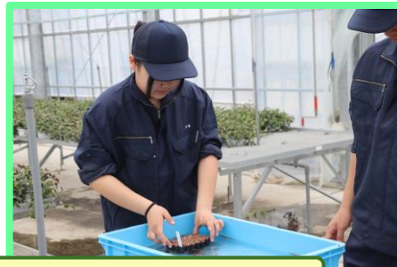
セルトレイの底面から水を吸い上げさせます（底面吸水）