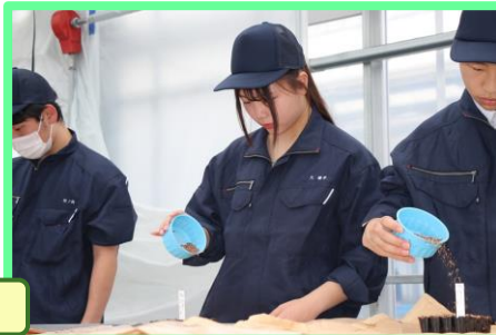
播種が終わったセルトレイに覆土します