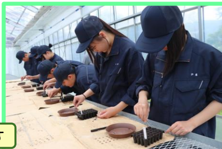
ピンセットを使い1粒ずつ丁寧に播種します