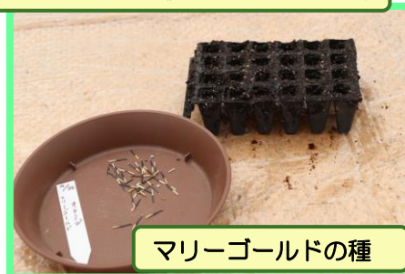
マリーゴールドの種