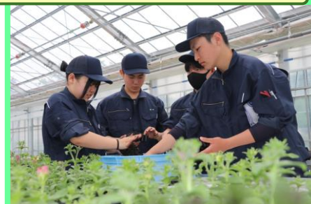
土の充填方法の説明を聞いて、各自15穴のセルトレーに土を詰め、別のセルトレーを使い植穴をあけます