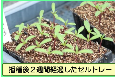
播種後2週間経過したセルトレイ