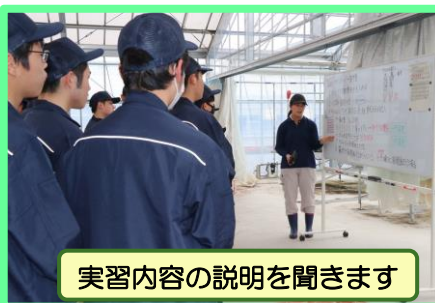
実習内容の説明を聞きます