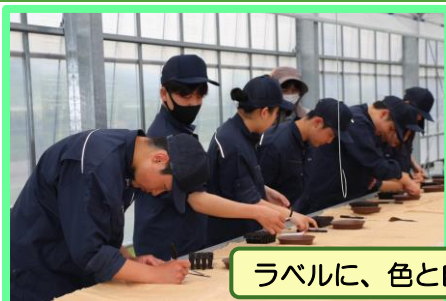
ラベルに、色と自分の名前を記入します